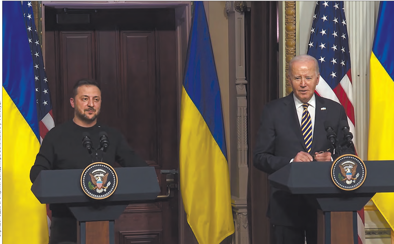
Скріншот відео зі сторінки Володимира Зеленського у фейсбуці.

У Білому домі відбулася зустріч президентів України та США Володимира Зеленського і Джо Байдена. Основними її темами стали оборонна співпраця, виділення фінансової допомоги Сполученими Штатами та майбутнє членство України в НАТО. Джо Байден поінформував: «Щойно підписав рішення про виділення 200 мільйонів доларів для оборони України», що включає критич-